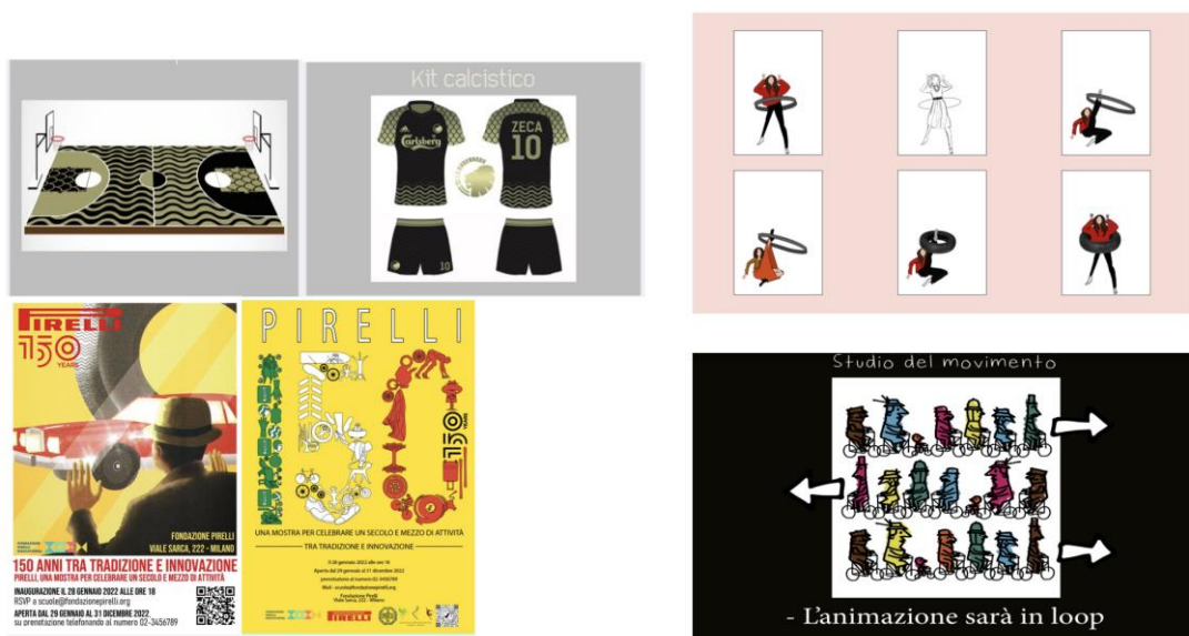
ILLUSTRAZIONE DEI PRODOTTI/PERFORMANCE REALIZZATI